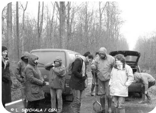
Le Groupe MARES bravant la neige printanière de l'Avesnois !

Un programme chargé les attendait : une présentation en salle des actions menées par le Parc dans le cadre de son programme de restauration de mares mis en œuvre depuis 2001, suivie d'une visite grandeur nature de mares restaurées sur la commune de Maroilles en 2003. La parcelle présente deux mares : une restaurée et l'autre non. Les 61 mares dorées et déjà restaurées sont toutes bâties sur le même modèle : un curage partiel en laissant de 50 cm à 1 m sur le côté, une clôture totale et un