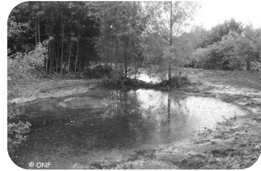
Après travaux, les pentes douces et l'éclaircissement améliorent le fonctionnement écologique des mares.

Une action pédagogique a également été menée en forêt de Boulogne avec une classe du lycée Mariette de Boulogne-sur-Mer.