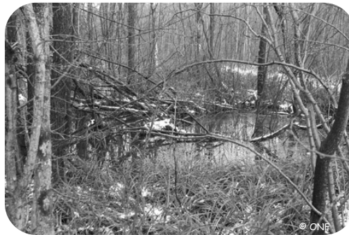
Une mare forestière avant restauration, envahie par la végétation.

L'intervention a consisté, pour les mares existantes, à un curage partiel du fond, un éclaircissement par enlèvement des ligneux autour des mares choisies et un reprofilage des berges le cas échéant. De même, les trous de bombes et d'obus les plus intéressants, hérités des guerres mondiales, ont fait l'objet des mêmes travaux de réhabilitation. Certaines mares ont été créées lorsque le milieu était propice et que les conditions de biotope le justifiait.