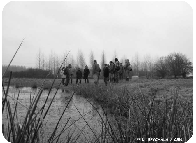
Réunion plénière à Maroilles (59), mars 2006

Parc naturel régional des Caps et Marais d'Opale