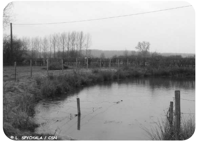
Une mare restaurée pour l'abreuvement du bétail, avec clôture et descente empierrée

Le programme mare avait fait l'objet en 2003 d'une journée avec le Conseil scientifique de l'environnement du Nord-Pas de Calais. Celle-ci avait eu un impact très positif au niveau des élus et agriculteurs locaux et a permis de faire connaître les travaux menés en Avesnois. Des actes ont été édités et sont disponibles sous format "pdf" sur le site Internet du Parc dans la partie "Nos éditions". Le document s'appelle "La préservation des mares prairiales en Avesnois, enjeux et programmes d'actions".