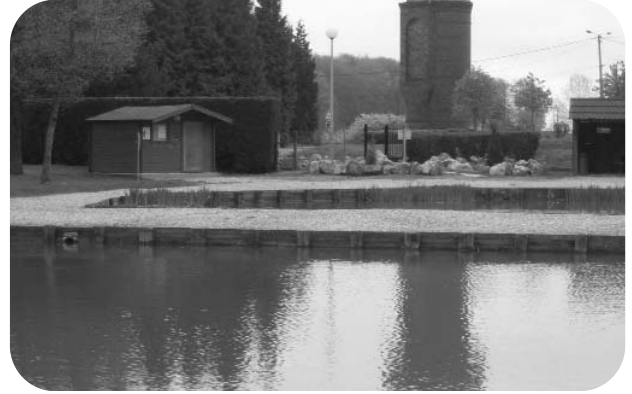
Les étangs de pêche, espaces soumis à une pression humaine importante

Trois mares intra-forestières ont ensuite