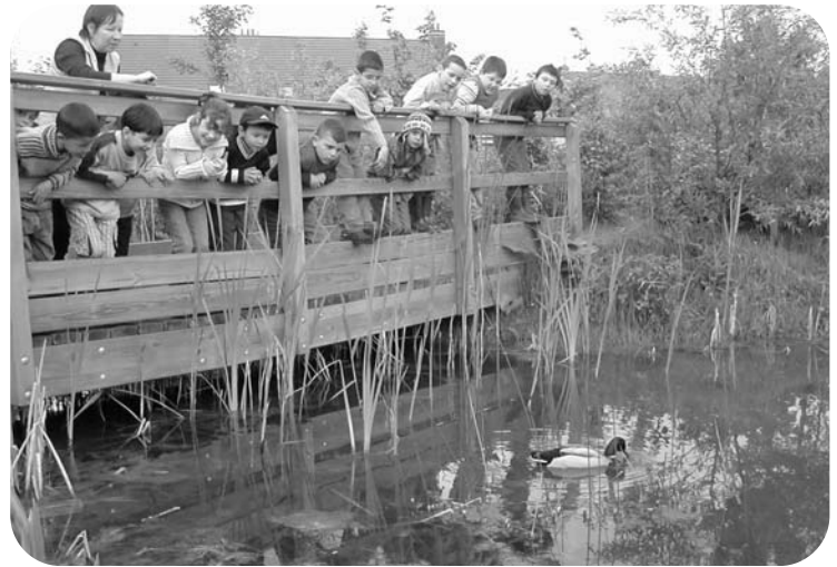
Angle 349 - Ecole Notre Dame de Lourde de Roubaix en pleine observation.

tél : 0320832081 / Email : ariste59@aol.com