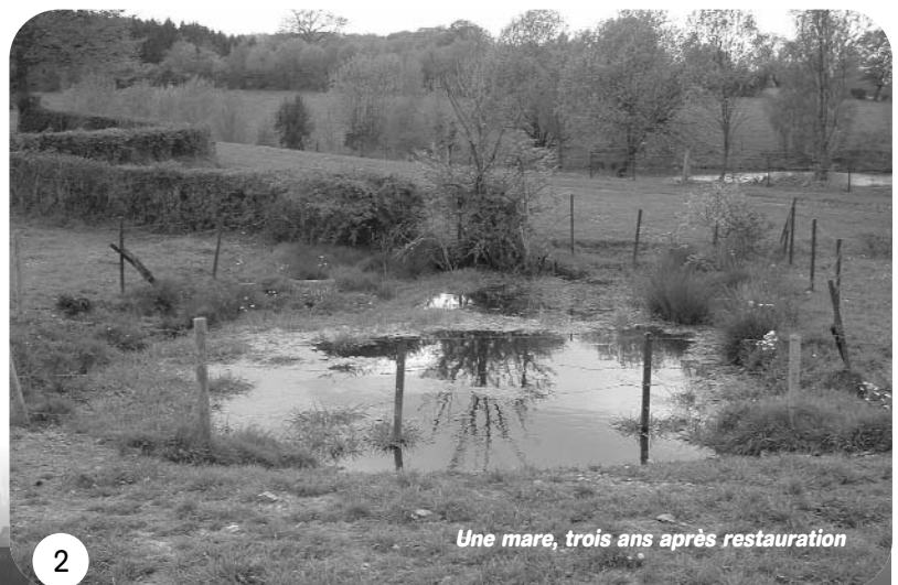
Une mare, trois ans après restauration

Elevé pour sa fourrure, le Rat musqué a été relâché dans la nature par les éleveurs dans les années 1960, lorsque la mode vestimentaire s'est tournée vers d'autres standards. L'espèce c'est alors multipliée, provoquant de nombreux dégâts avec leurs galeries : berges fragilisées, mares se