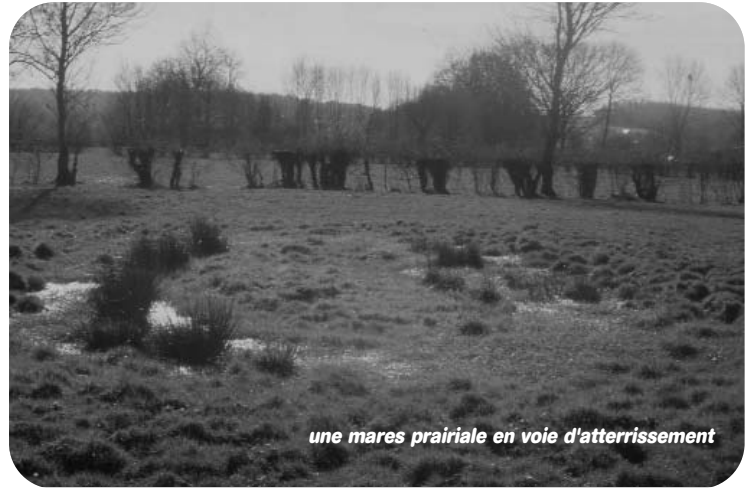
une mare prairiale en voie d'atterrissement

En premier lieu, l'eau de la mare est analysée. L'objectif n'est pas de juger des pratiques culturales, mais de s'assurer de la qualité d'eau d'abreuvement des bêtes (les taux en nitrates, phosphates...). Ensuite, après une visite de site, le Parc propose alors un aménagement et chiffre le coût des travaux : pose de clôtures, descentes empierrées... Une convention de gestion est enfin signée entre l'agriculteur et le Parc, qui finance 80% du coût des travaux. Le curage se réalise en période sèche (fin août) afin d'évi-