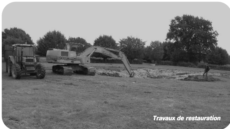
Travaux de restauration

En outre, l'absence de clôtures favorise le développement de maladies parasitaires ou d'origine bactériologique.