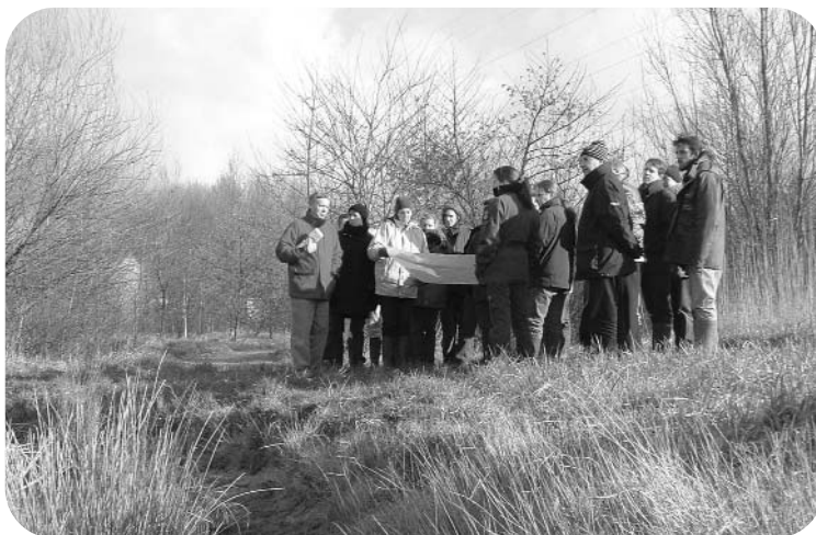
Le groupe MARES à l'action - Visite de la Coulée Verte de Mardyck, février 2004

En cette période de vœux, il convient d'espérer la réussite du projet. Il reste à chacun de nous d'amplifier la dynamique autour des actions en cours ou à venir pour assurer la préservation des mares de la région.